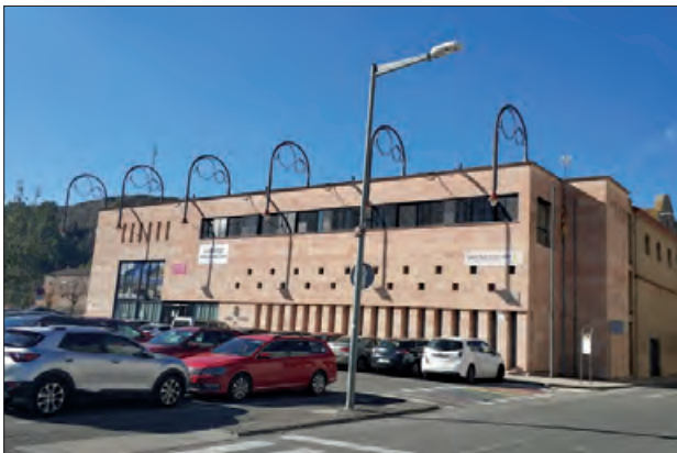
Consell Comarcal de la Noguera

Les actuacions subvencionables són actuacions