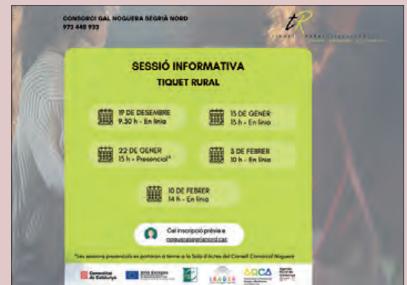
Calendari de sessions informatives

una en traspàs, així com també a persones jurídiques i a cooperatives no agràries interessades a impulsar un nou negoci o agafar el relleu d'una empresa ja en funcionament. El termini per presentar sol·licituds finalitza el 14 de febrer de 2025.