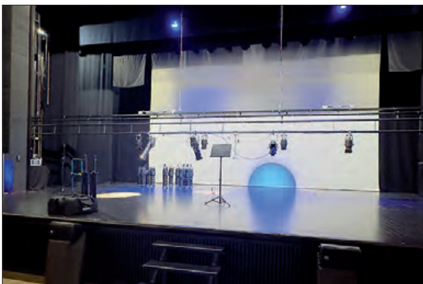
Nous sistema il·luminació al Teatre

El Teatre Municipal de Balaguer ha realitzat l'adquisició d'un nou sistema d'il·luminació amb tecnologia LED, per a la millora de les seves instal·lacions.