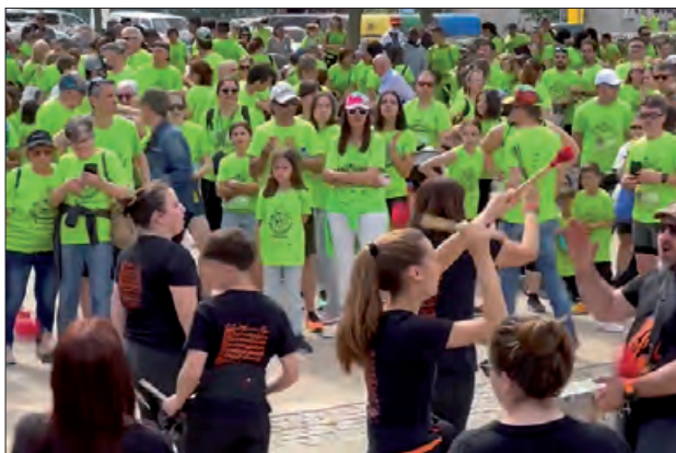
Fira dels Somnis 2024

El passat 18 de desembre, es va donar el tret de sortida a la Fira dels Somnis pel càncer infantil que tindrà lloc a Balaguer el diumenge 4 de maig. La Fira dels Somnis és un projecte de participació comunitària que pretén