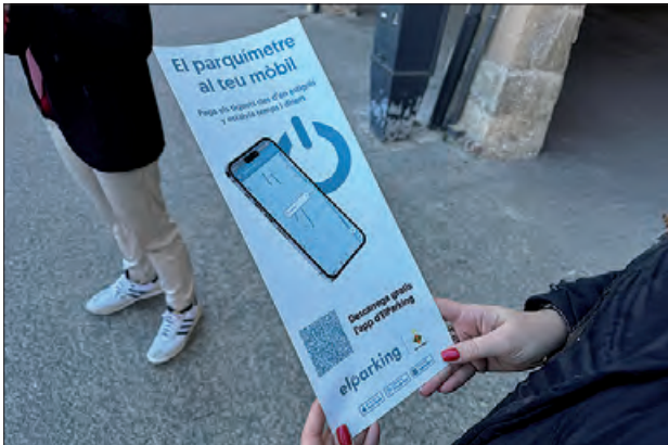
Aplicació pàrking zona blava

La Paeria de Balaguer va presentar el passat mes de desembre, la incorporació d'una aplicació per a mòbils per a poder realitzar el pagament de la zona blava