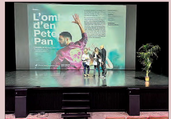
Un moment de la presentació

La informació de les obres i la compra d'entrades i abonaments es pot fer a l'Oficina de Turisme o a través de la pàgina www.entradesteatre.balaguer.cat