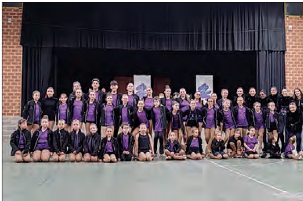
Participants al festival

El CP Bellcaire va organitzar el dissabte 21 de desembre el Festival de Nadal, enguany es van interpretar cançons de la pel·lícula Mama Mia. Les patinadores i patinadors van captivar al un pavelló ple de gom a gom, amb les originals coreografies que van representar, oferint una visió original del musical. L'espectacle va ser ofert per part del club i del Grup de Xous Petits de Torregrossa com a club convidat.