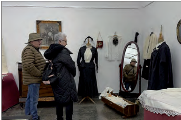
Exposició “Antic i Bonic”

antics (com mobles, teixits i eines tradicionals), que pretén ser un record emocional, cultural i històric,