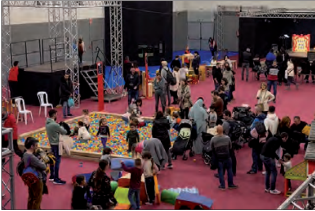
Cosmolúdic durant el Nadal a Balaguer

Des del 28 de novembre que es va inaugurar la campanya comercial de Nadal amb l'encesa de llums i l'arribada de la Polsim, Balaguer ha gaudit de diferents activitats per a