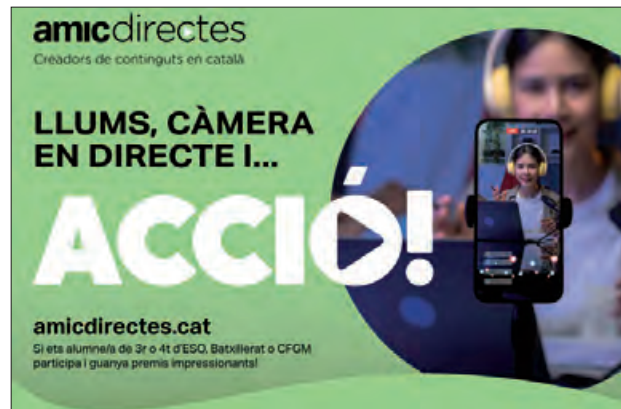
Imatge del concurs