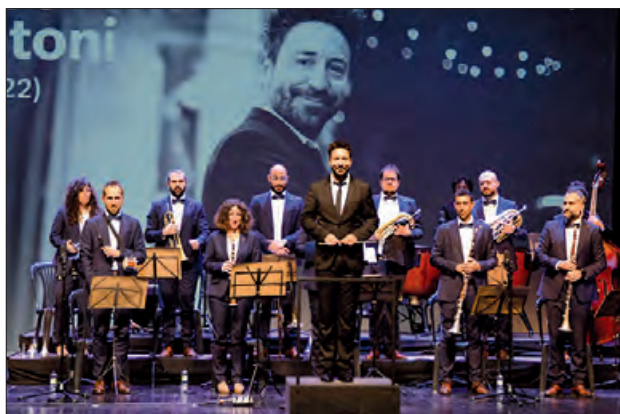
Un moment del concert Reixos Fusió