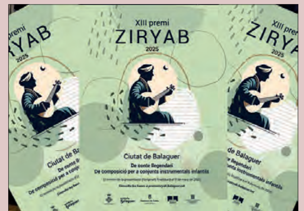
Cartell Premis Ziriyab

Les bases es poden consultar a premis-ziriyab.balaguer.cat