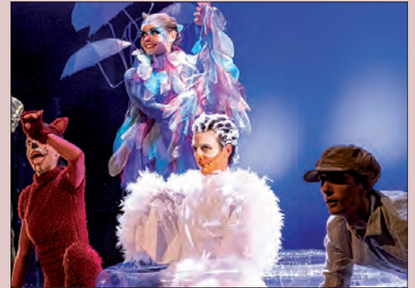
Pere i el llop del Ballet Contemporani de Catalunya

La Paeria de Balaguer organitza un any més el cicle d'hivern d'espectacles infantils, l'Emboirats, que enguany arriba a la 6a edició.