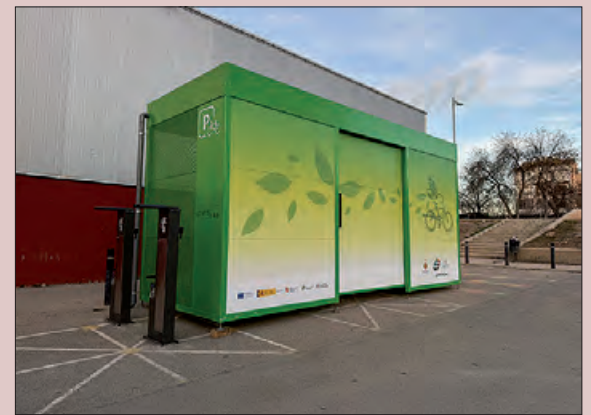
Mòdul per a bicicletes al costat del Molí de l'Esquerrà

Aquesta actuació forma part del projecte "Naturalment Lleida", liderat pel Patronat de Turisme de la Diputació de Lleida, finançant amb Fons Next Generation de la Unió Europea.