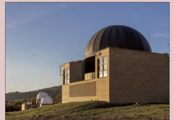
Parc Astronòmic del Montsec

Amb aquestes xifres, el Parc Astronòmic del Montsec es consolida com un dels equipaments turístics més importants de la zona, i continua sent una destinació destacada per als amants de l'astronomia, la cultura i el turisme familiar. A més de contribuir amb l'economia i el creixement d'aquesta zona.