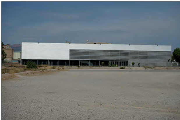
La pista se situarà davant d'Inpacsa

La Paeria de Balaguer ja compta amb la redacció del projecte de la futura pista d'atletisme de la ciutat. La futura pista esta-