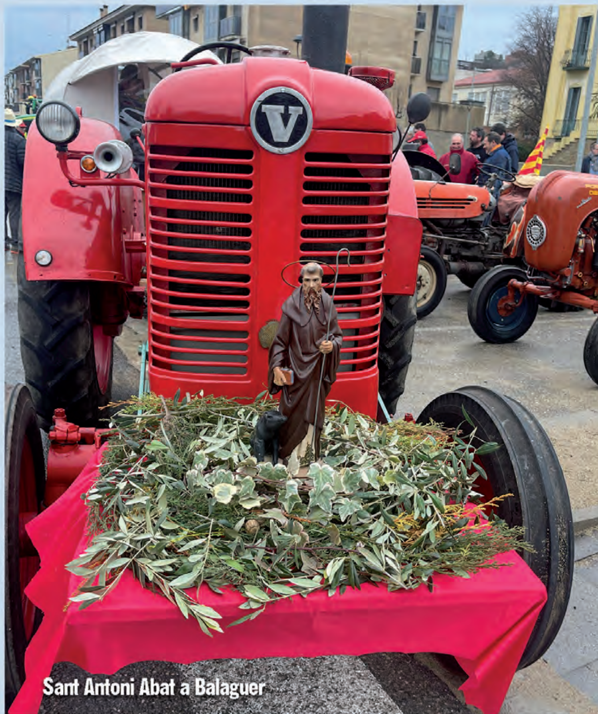
Sant Antoni Abat a Balaguer

El divendres 17 de gener se celebrarà la festa de Sant Antoni a Balaguer