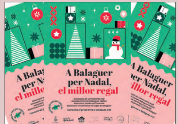
Cartell del sorteig dels vals de compra

La campanya comercial de Nadal va començar el 28 de novembre coincidint amb l'encesa dels llums de Nadal. Les associacions van organitzar paral·lelament diverses activitats durant tot el mes de desembre i gener com per exemple, sortejos de premis, concerts de nadesles, espectacles infantils i de dansa, i tastos de coca amb xocolata. Les diferents associacions han valorat positivament la campanya d'aquest Nadal.