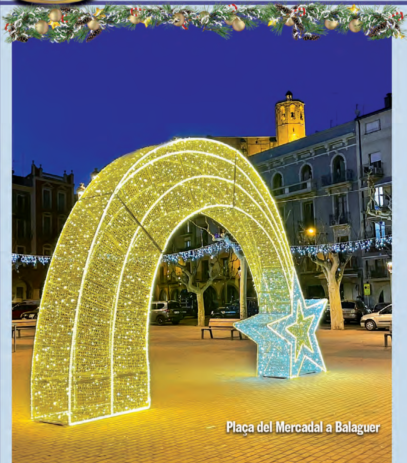
Plaça del Mercadal a Balaguer