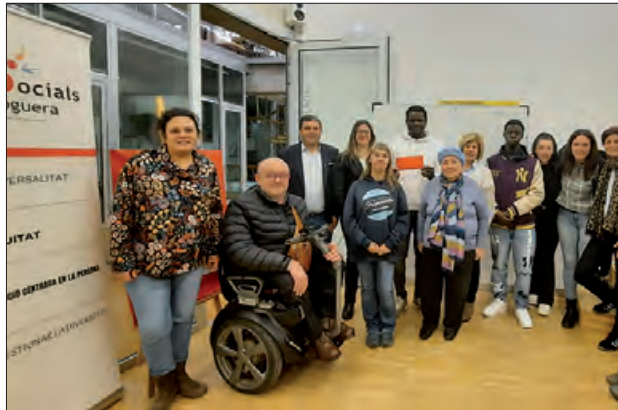
Un moment de l'acte

Tot seguit es va lliurar els premis de la rifa de la Cistella Solidària que la Taula d'Entitats que va sortejar durant la Fira d'Entitats. Amb totes les donacions de particulars i entitats es van poder sortejar 4 paneres: la Muralla, la Reguereta, la Mercadal i les Franqueses, que han estat exposades en un local del carrer Major de Balaguer. La recaptació va destinada al premi del Concurs de Suggestiments Solidaris.