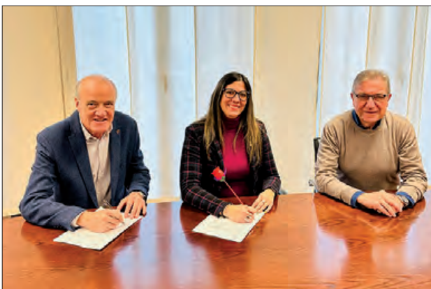
Signatura del conveni

Divendres 13 de desembre, es va signar el conveni de col·laboració, entre la Creu Roja de la Noguera i la Paeria de Balaguer.