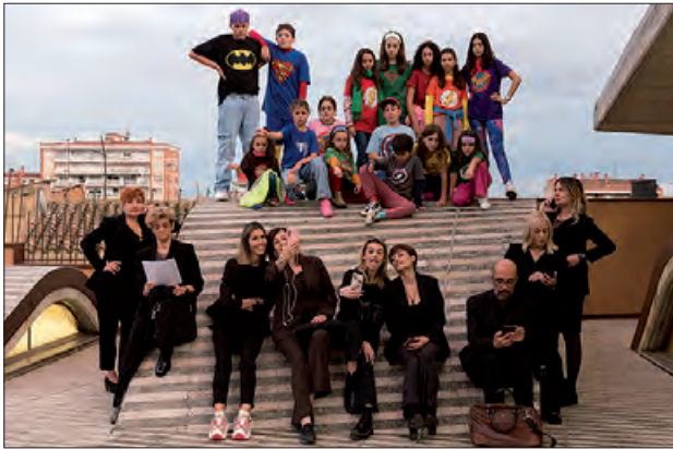
Protagonistes de l'obra "Colors Bells"

Les entrades es poden comprar anticipades per 8 euros a l'Estanc San Agustín, al Restaurant Cal Xirricló o per WhatsApp al 620 401 568. També es podran comprar a taquilla una hora abans de la representació per 10€.