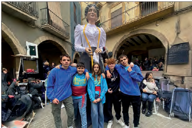
La Modista i els seus portadors

La Modista és una geganta de 3 metres i 10 centímetres, que pesa 19 Kg i