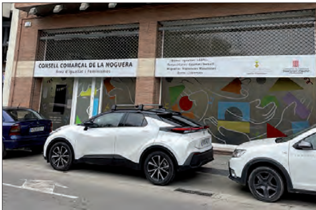
Seu de l'Àrea d'Igualtat i Feminismes del Consell