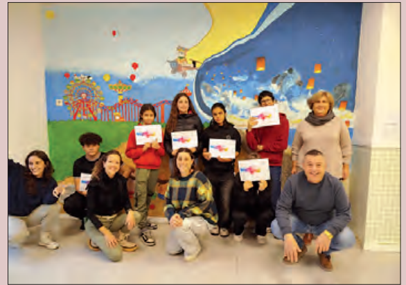
Cloenda del taller

Per celebrar la cloenda del taller i la presentació del mural, van rebre els títols en reconeixement de la feina feta.