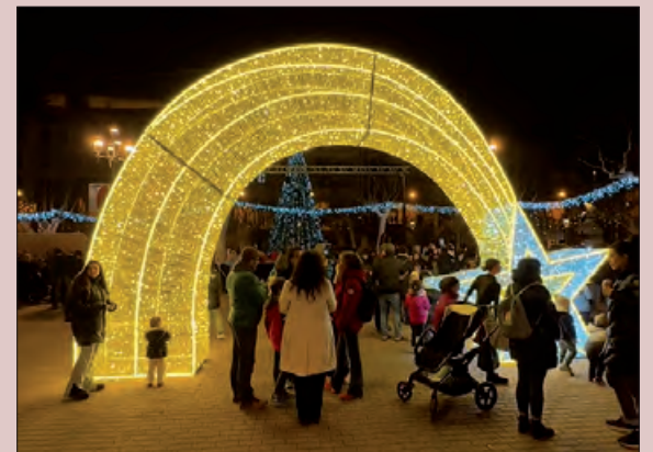
Llums de Nadal per la ciutat

També s'han organitzat diferents activitats durant les festes de Nadal, on petits i grans podran gaudir-ne, com espectacles de carrer, contacontes, tallers de decoració nadalenca, música en directe, xocolatades a càrrec de diferents forns i pastisseries de la ciutat. També un concurs de fotografia per xarxes socials amb els elements d'il·luminació nadalenca 3D de la ciutat. Informació que es pot trobar al web de la Paeria.