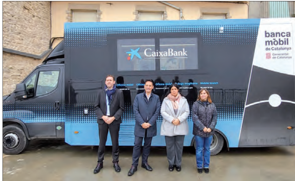
Peu de foto: La Banca Mòbil permet realitzar tots els serveis que fa una oficina bancària

Fins ara, no tenir accés als serveis financers al lloc de residència obligava els veïns i les veïnes d'aquests municipis a anar fins al poble més pròxim amb oficina bancària o caixer automàtic per fer gestions tan habituals com retirar o ingressar diners. En aquest sentit, la consellera d'Economia i Finances, Àlicia Romero, subratlla que "la Banca Mòbil de Catalunya respon a la voluntat