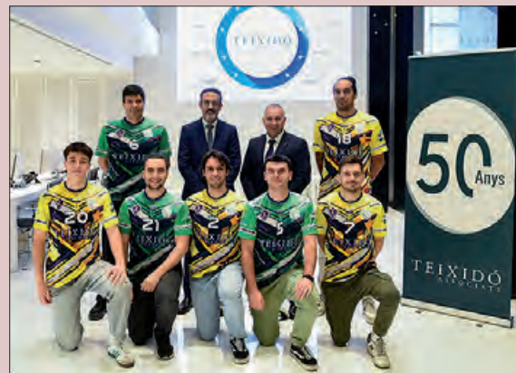
Presentació del Teixidó CV Balaguer-CE INEF Lleida

Aquest és el segon equip masculí de la província, i competeix a la categoria més alta del vòlei català. L'equip milita a la Primera Divisió Sènior Masculina de la Federació Catalana de Voleibol, on l'objectiu és aconseguir la permanència, i poder aspirar a l'ascens en les temporades vinents.