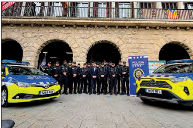
Un moment de l'acte

Un dels reconeixements més especials va ser la medalla al mèrit rebuda per al cap de la policia local de la població valenciana d'Alfajar, on quatre agents de la Guàrdia Urbana de Balaguer van desplaçar-se per tal de col·laborar i prestar la seva ajuda, després de les greus inundacions causades per la DANA.