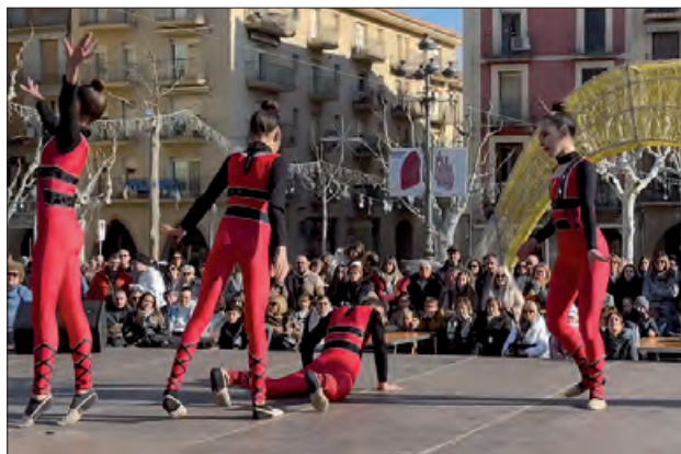
Actes a la Plaça Mercadal

Balaguer va celebrar de desembre la matinal el mati del diumenge 15 per la Marató de TV3, que