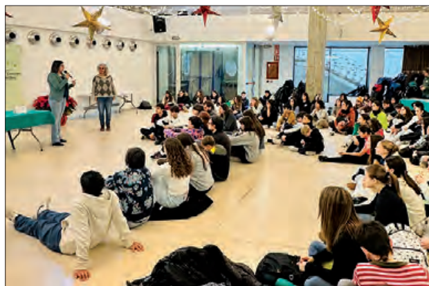
Fòrum d'Escoles Verdes

En aquesta trobada van participar representants de 12 centres d'Educació Secundària de les comarques de la Noguera, el Segrià, l'Aran i el Pallars Jussà, amb un total de 80 alumnes i 25 docents. Hi van assistir l'Institut Almatà, Vedruna Balaguer, Institut Ciutat de Balaguer, Escola Pia Balaguer, Institut d'Almenar, Institut Joan Solà, Institut de Seròs, Institut