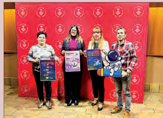
Presentació del Cagasoca i Cosmolúdic

L'entrada tindrà un preu de 2€ per assistent, i també es podrà adquirir un abonament per a tots els dies que tindrà un preu de 25 €.