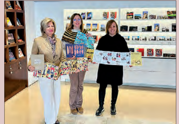
Un moment de la presentació de l'acte

La Paeria de Balaguer va presentar una nova edició de la col·lecció 'Imaginari i tradicions balaguerines', dedicada a les Festes del Sant Crist i que es titula 'Pagis Magis'. Aquest desplegable és el tercer de la col·lecció, i ha estat il·lustrat per Miguel Bustos, el qual també va crear el cartell de la Festa Major de 2022, que es va presentar durant l'Encontats.