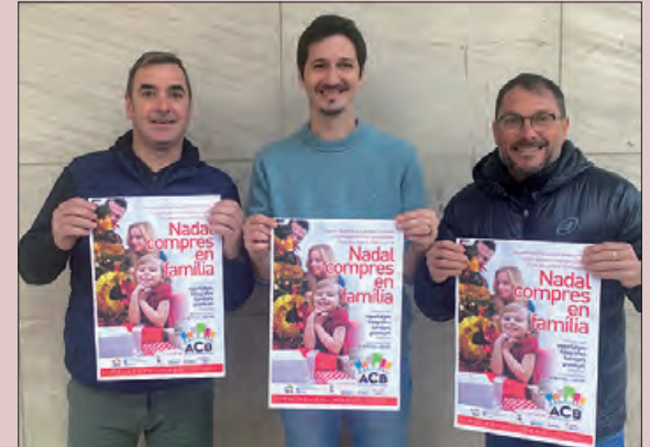
Membres de la Junta amb el cartell de la Campanya

L'Associació de Comerciants de Balaguer ACB ha posat en marxa una nova campanya per aquestes dates tant assenyals per tal d'incentivar i fidelitzar el comerç local des d'una perspectiva més humana, creant vincles entre comerciants i clients reforçant l'experiència de compra amb un toc d'il·lusió i calidesa familiar.