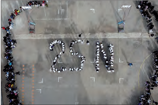
Mosaic gegantí al pati de l'Institut Almatà

L'Institut Almatà va commemorar el Dia Internacional per a l'Eliminació de la Violència envers les Dones amb diverses activitats de sensibilització i reflexió. A les hores de tutoria, l'alumnat va participar