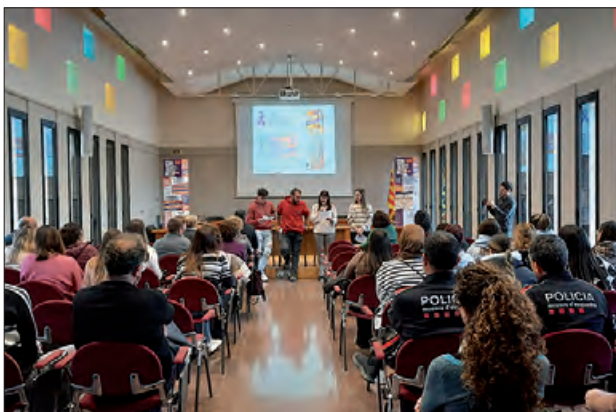
Actes del 25N al Consell Comarcal

El passat 25 de novembre, al Consell Comarcal de la Noguera es va commemorar el Dia Internacional per a l'Erradicació de les Violències envers les Dones.