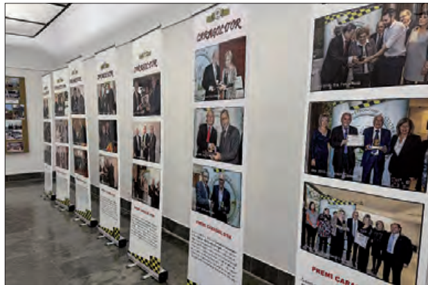
Una imatge de la inauguració de l'exposició

Aquesta mostra pretén posar en valor la tasca de la Societat Gastronòmica i Cultural del Comtat d'Urgell, la qual treballa per la cultura i el patrimoni immaterial tant de la ciutat. Es podrà veure fins el 18 de desembre.