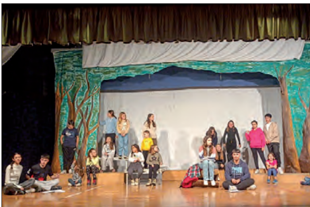
Un moment durant un assaig

La campanya s'allargarà fins el 6 de gener '25.