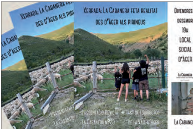
Presentació de la revista La Cabanera

La fira artesana d'Àger es va celebrar el passat 1 de desembre, arribant a la seva 27a edició.