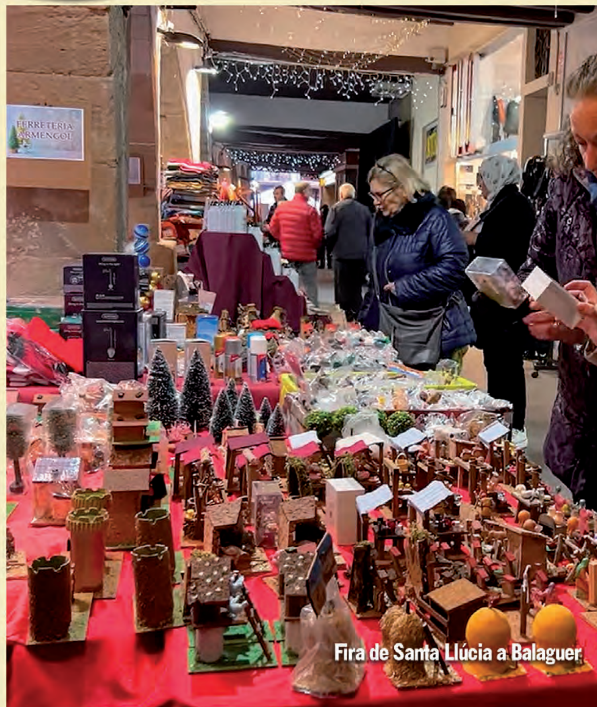
Fira de Santa Llúcia a Balaguer