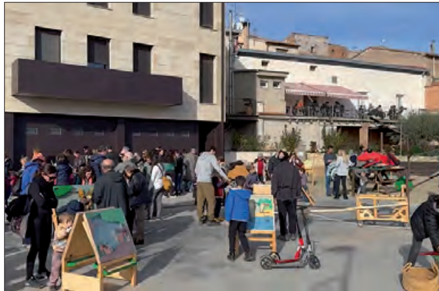
Fira de les Aspres

Una activitat molt esperada per als més petits, serà l'arribada del comitè dels Reis Mags d'Orient, que vindran a les 12.15 h a recollir les cartes de petits i grans. Abans d'acabar la fira, es farà el sorteig de la Gran Cistella.