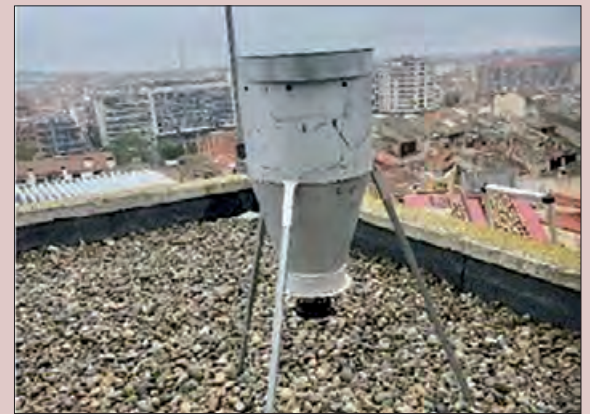
Dispensador d'aliment per a coloms

Les ubicacions s'han escollit per les zones on actualment es concentren més quantitat d'exemplars, en especial al Centre Històric.