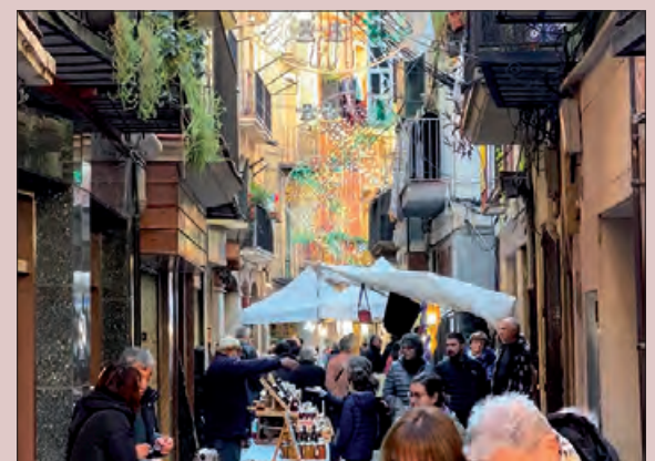
Mercat de Santa Llúcia de l'any passat

A la plaça del Pou s'instal·larà un photocall en el que els infants que vulguin podran fer-se una foto i després publicar-la a xxss per tal de participar del sorteig d'abonaments per al Cosmolúdic. Per a participar caldrà citar el perfil @firesifestesbalaguer i l'etiqueta #santallucia-blg2024.