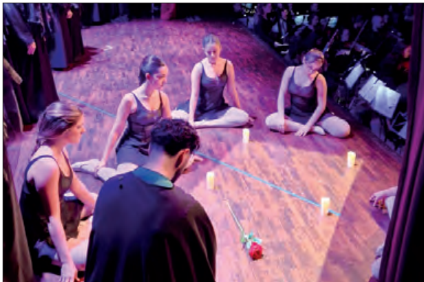
Ballarines de Balaguer en un moment de l'òpera

coreografies i sota la direcció d'Albert Bonet., al Teatre de l'Ateneu de Cerdanyola del Vallès el dissabte 30 i el diumenge dia