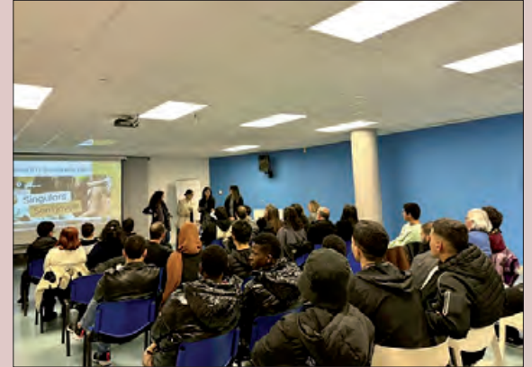
Un moment de l'acte

A finals de novembre es va celebrar a les instal·lacions del CEI Balaguer, la cloenda del Projecte Singulars 'Som Joves' 2023, dut a terme conjuntament per la Paeria de Balaguer i l'Associació Reintegra. Aquest projecte anava adreçat a joves de 16 a 29 anys, amb l'objectiu d'acompanyar-los en el procés de recerca de feina i la millora de l'ocupabilitat, per aconseguir la seva inserció al mercat laboral.