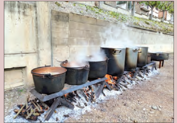
Un moment en el repartiment del Ranxo

Una visita teatralitzada a l'exposició "Els establiments a l'època dels treballs", a càrrec del grup de teatre local, ones va poder conèixer la història de forma pedagògica i divertida.