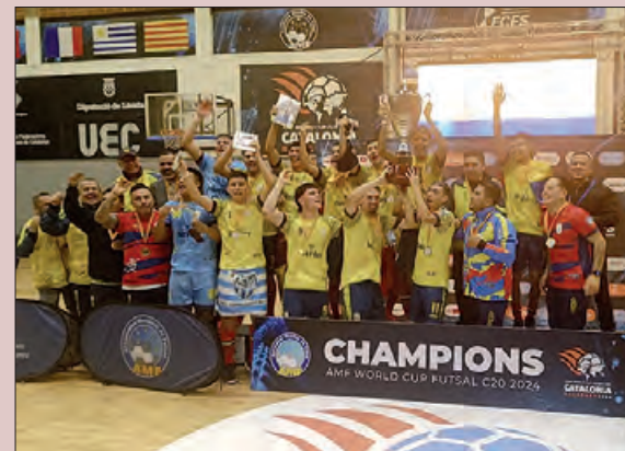
Colòmbia equip guanyador

El Mundial Sub-20 de futbol sala va finalitzar al pavelló 1r d'Octubre de Balaguer, el passat diumenge 24 de novembre, amb la victòria de la selecció de Colòmbia, imposant-se a Paraguai en una final intensa.