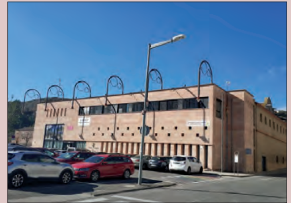
La jornada es va fer al Consell Comarcal

L'Àrea de Turisme del Consell Comarcal de la Noguera va organitzar una jornada formativa adreçada a empresaris i empresàries i personal tècnic del sector del turisme de tota la comarca.