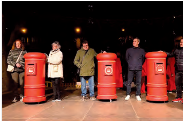
Presentació de la campanya comercial

En el context de la campanya comercial, un any