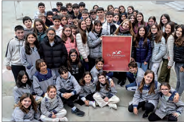
Alumnes participants als Pastorets 2024

Les representacions es faran el dissabte 21 a les 17 h i el diumenge 22 a les 18.30h, al teatre del centre, amb la participació de més de 80 escolars de tots els cursos, un rècord de número d'actors que ha obligat a ampliar personatges. L'obra, que està impulsada per l'Associ-