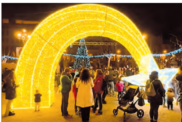
Encesa de llums d'enguany