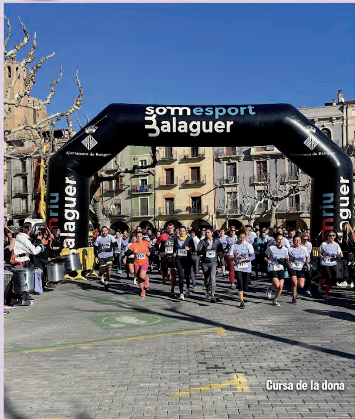
Cursa de la dona