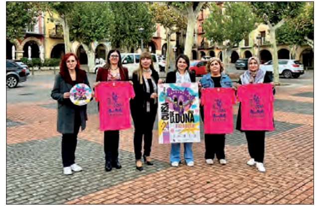
Presentació Cursa de la Dona 2024

Les inscripcions es tancaran el divendres 22 de novembre, o quan s'arribi a les 800 participants, i tin-