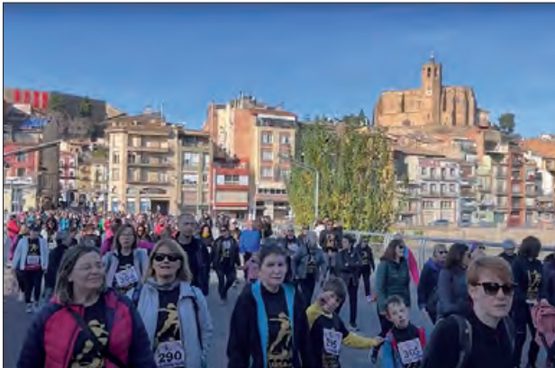
Un moment de l'any passat

Diumenge 24 de novembre, Balaguer celebrarà la cursa de la Dona Balaguer 2024, en el marc de la Setmana contra la Violència de Gènere, encapçalada pel dia 25 de novembre com a Dia Internacional per a l'eliminació de la violència vers les dones.