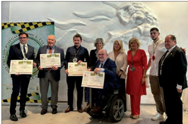
Acte d'Investidura de 2024