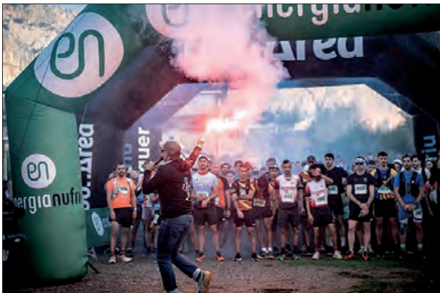
Un moment de la sortida

cipació, uns 800 corredors/es es van aplegar a la cursa amb sortida i arribada des de Sant Llorenç de Montgai.