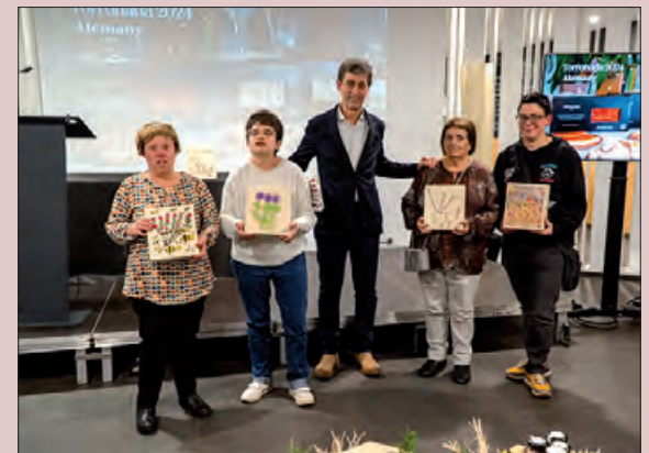
Les quatre guardonades