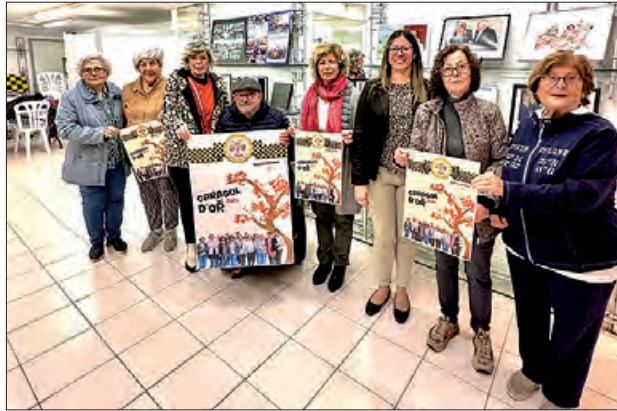
Lliurament Premi Cargol d'Or 2024

Enguany, la Societat Gastronòmica i Cultural del Comtat d'Urgell ha decidit atorgar el Caragol d'Or 2024 a l'Associació Dona Rural, per la seva participació desinteressada en diferents activitats a Balaguer, les quals contribueixen a conèixer i mantenir les tradicions populars de la ciutat. En aquest sentit, duen a terme tota mena d'activitats i propostes, com poden ser l'elaboració de carrosses per la festivitat de Sant Antoni; el rentat de roba a la Reguereta amb motiu de la festa de l'Harpia; la preparació de l'olla de congre per