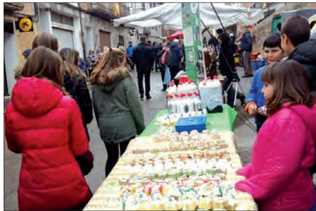
Fira d'Àger de l'any passat

El dia 1, dia de la Fira, es farà l'obertura a les 11 i durant tot el matí, es podrà gaudir d'animacions al carrer amb l'Esperanceta de Casa Gassia i música en viu a càrrec de Folk i Maxa. Una ex-