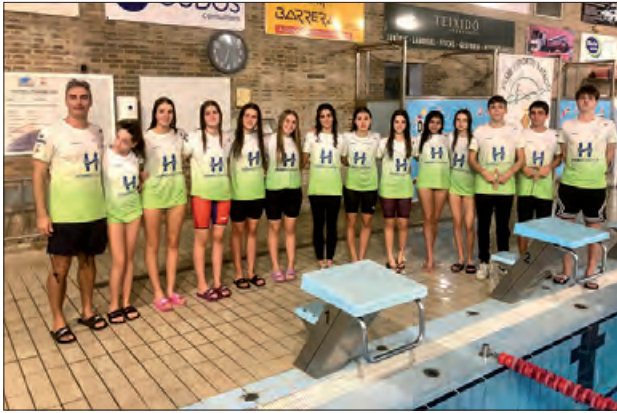
Nedadors del CEN Balaguer

El passat dissabte 9 de novembre, es va disputar la 2a Jornada de la Lliga Catalana Infantil i Trofeu absolut a la piscina municipal de Balaguer.