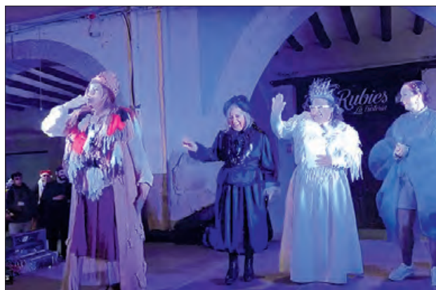
Les patgesses i la Polsim