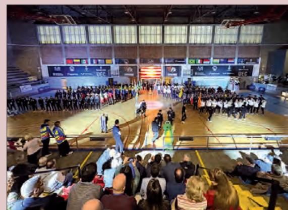
Un moment de la inauguració

Seguidament, es van anunciar les seleccions participants, les quals son Brasil, Uruguai, Índia, Paraguai, Itàlia, Austràlia, Mònaco, Colòmbia, Mèxic, França i Catalunya, les quals van desfilar fins al centre de la pista.