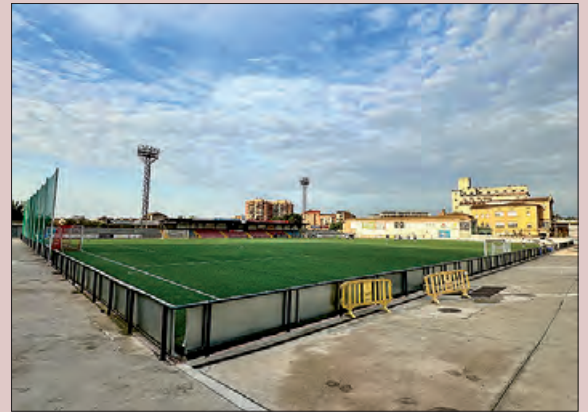
Camp Municipal d'Esports

En aquest sentit, des de la Paeria de Balaguer s'ha optat per aquest tipus d'element per tal de poder optimitzar els recursos i compartir espais per a la informació.