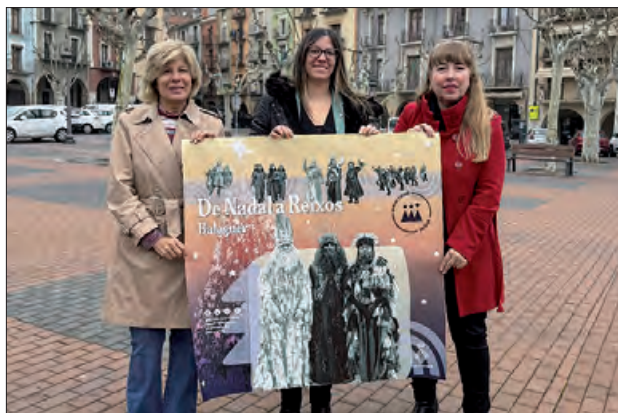
Presentació "De Nadal a Reixos"

La següent activitat està prevista pel dia 21 de desembre, quan es farà el Caga-soca i l'arribada de les Llamineres al Teatre municipal, i el divendres dia 27 al vespre es farà l'arribada dels Carboners i la